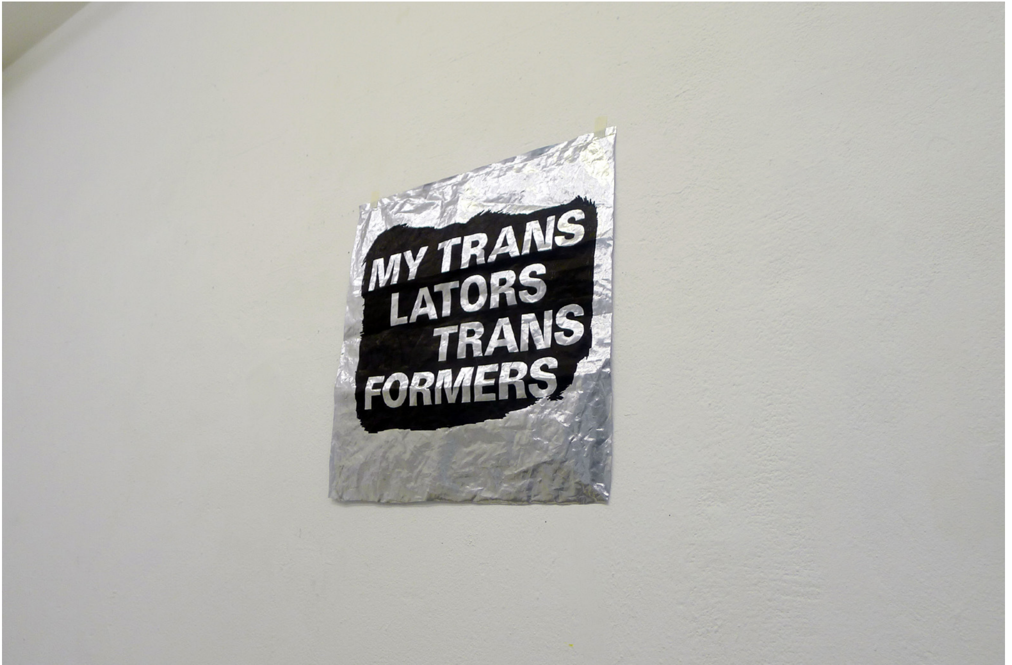
my translators, 2014 paintmarker sur vinyl, 50 x 50 cm