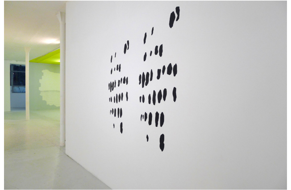
vue de l'exposition À l'heure du dessin, 2e temps, 2015 Château de Servières, Marseille