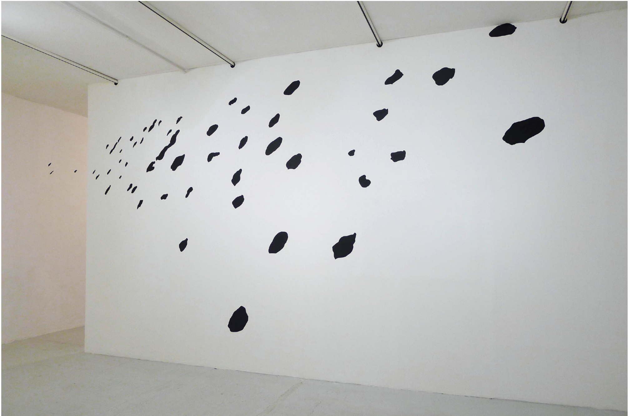
sans titre (paroles), 2015 oxyde de fer, liant acrylique sur mur, dimensions variables