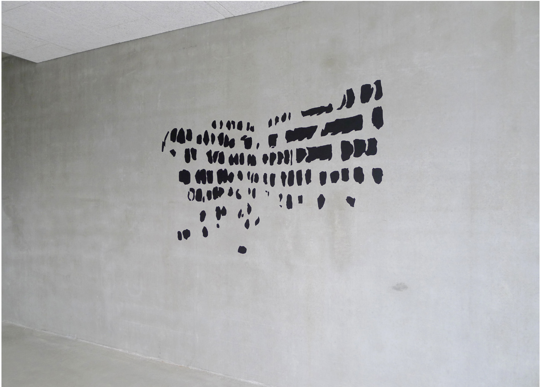
paroles, 2013 oxyde de fer, liant acrylique sur béton, École Polytechnique d'Ulm