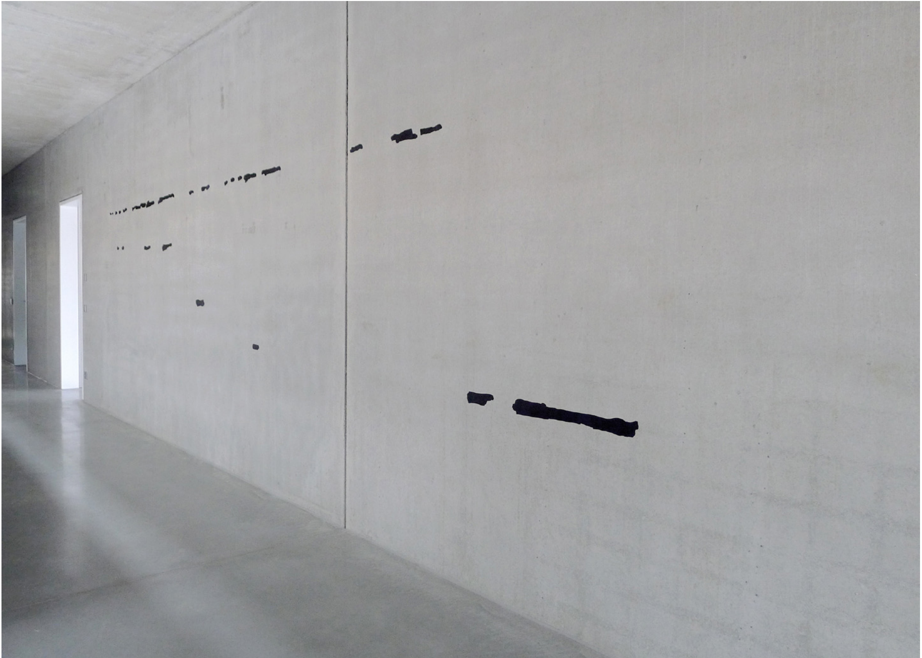
paroles, 2013 oxyde de fer, liant acrylique sur béton, École Polytechnique d'Ulm