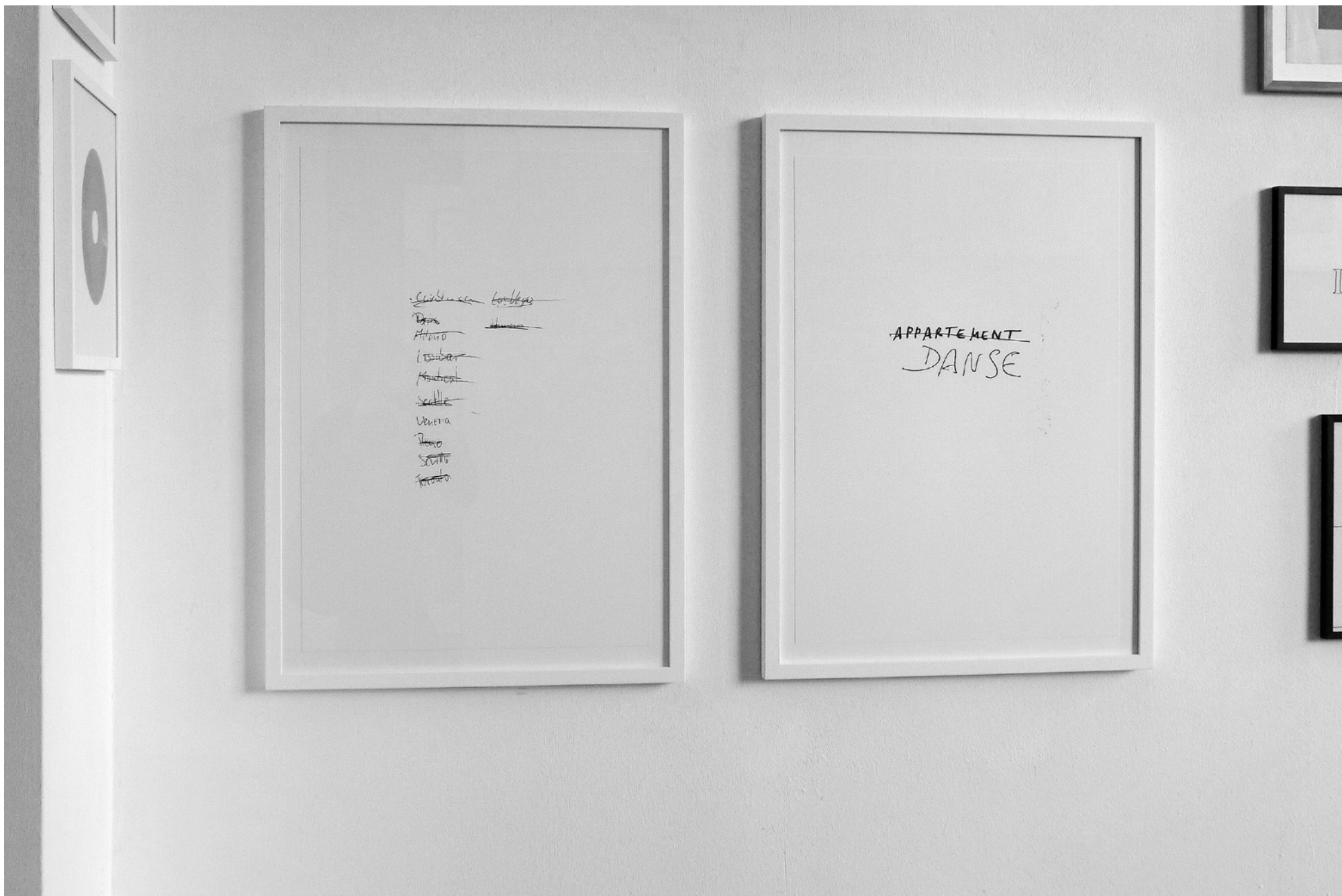
vue de l'exposition CROSSWORDS 2, 2014, Galerie Jordan/Seydoux, Berlin à gauche : Venezia, 2011, sérigraphie, 63 x 44 cm / à droite : Danse, 2010, sérigraphie, 63 x 44 cm