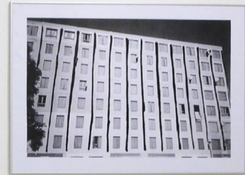
à gauche : sans titre, de la série M Édition, 2014 impression numérique, 29 x 42 cm, éd. 5+2 e.a.