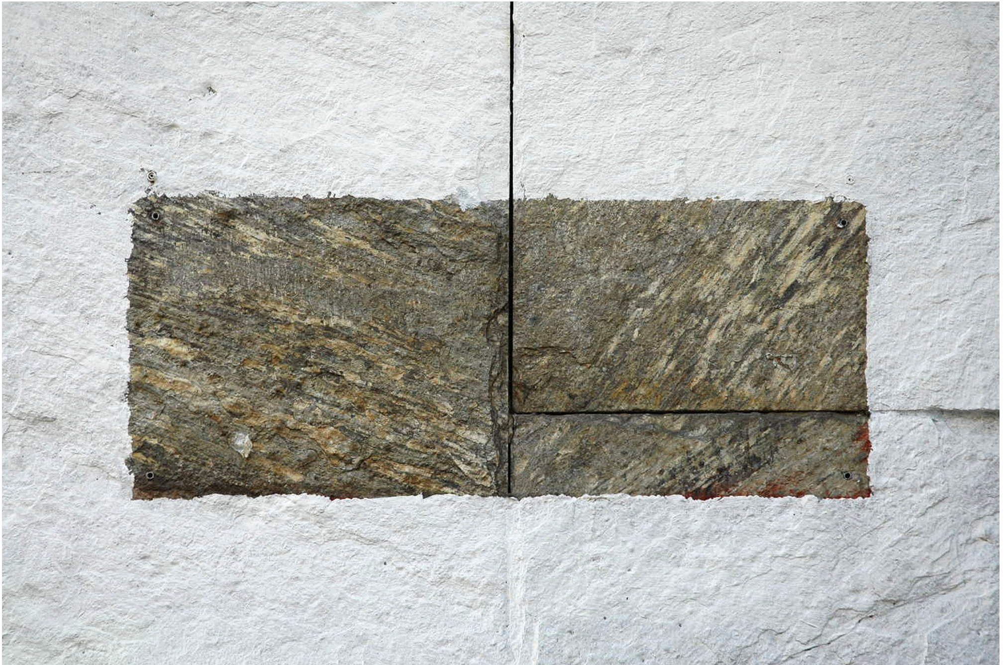
mur, 2013 impression numérique, 89 x 129 cm, éd. 3+1 e.a.