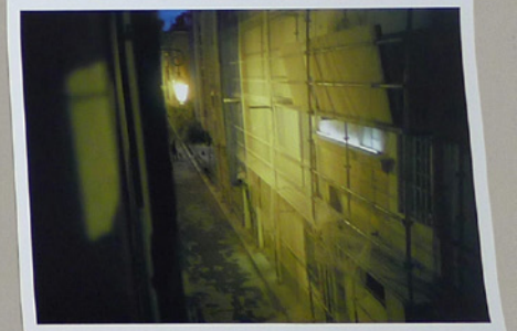
M, 2014, Édition 8 photographies prises à Marseille 2001-2010, impressions numériques, 29 x 42 cm avec marge