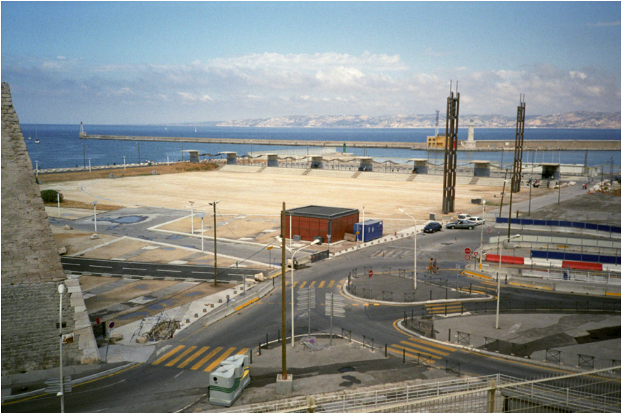
sans titre, de la série M photographie prise à Marseille 2001-2010